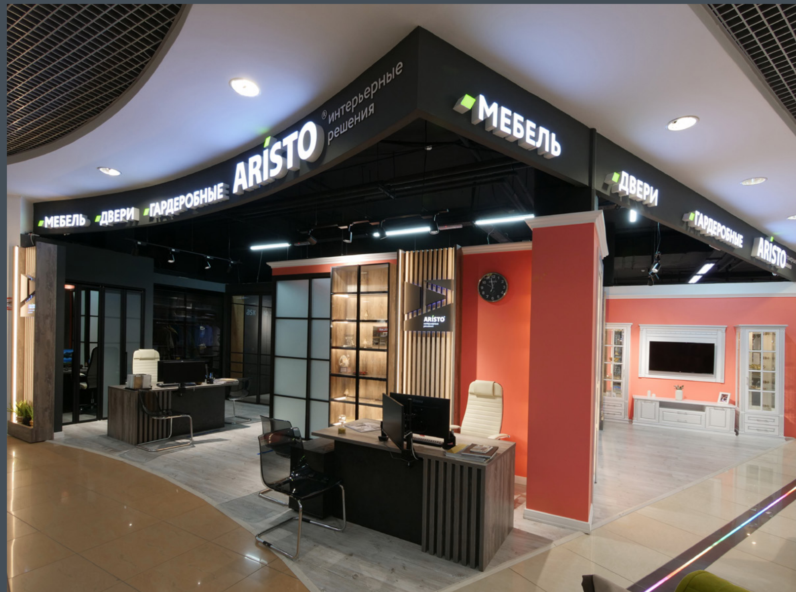
Салон Интерьерные решения ARISTO, г. Краснодар