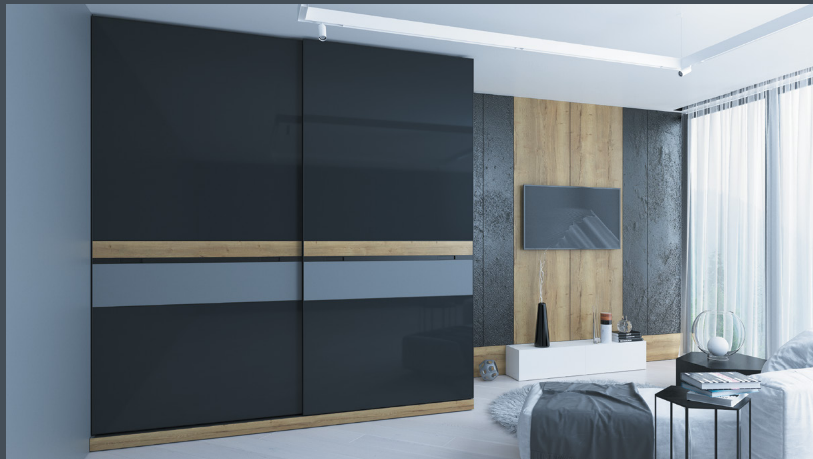
Реализация жилого пространства на основе продукции ARISTO