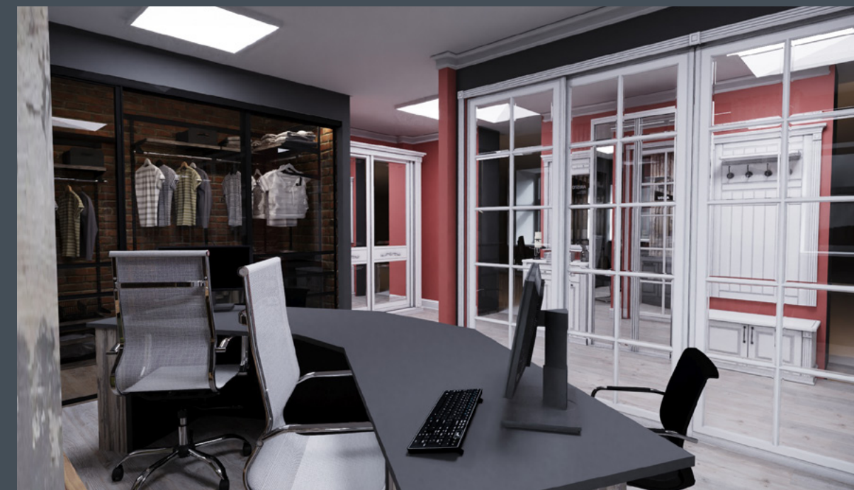
Салон Интерьерные решения ARISTO, г. Ростов на Дону