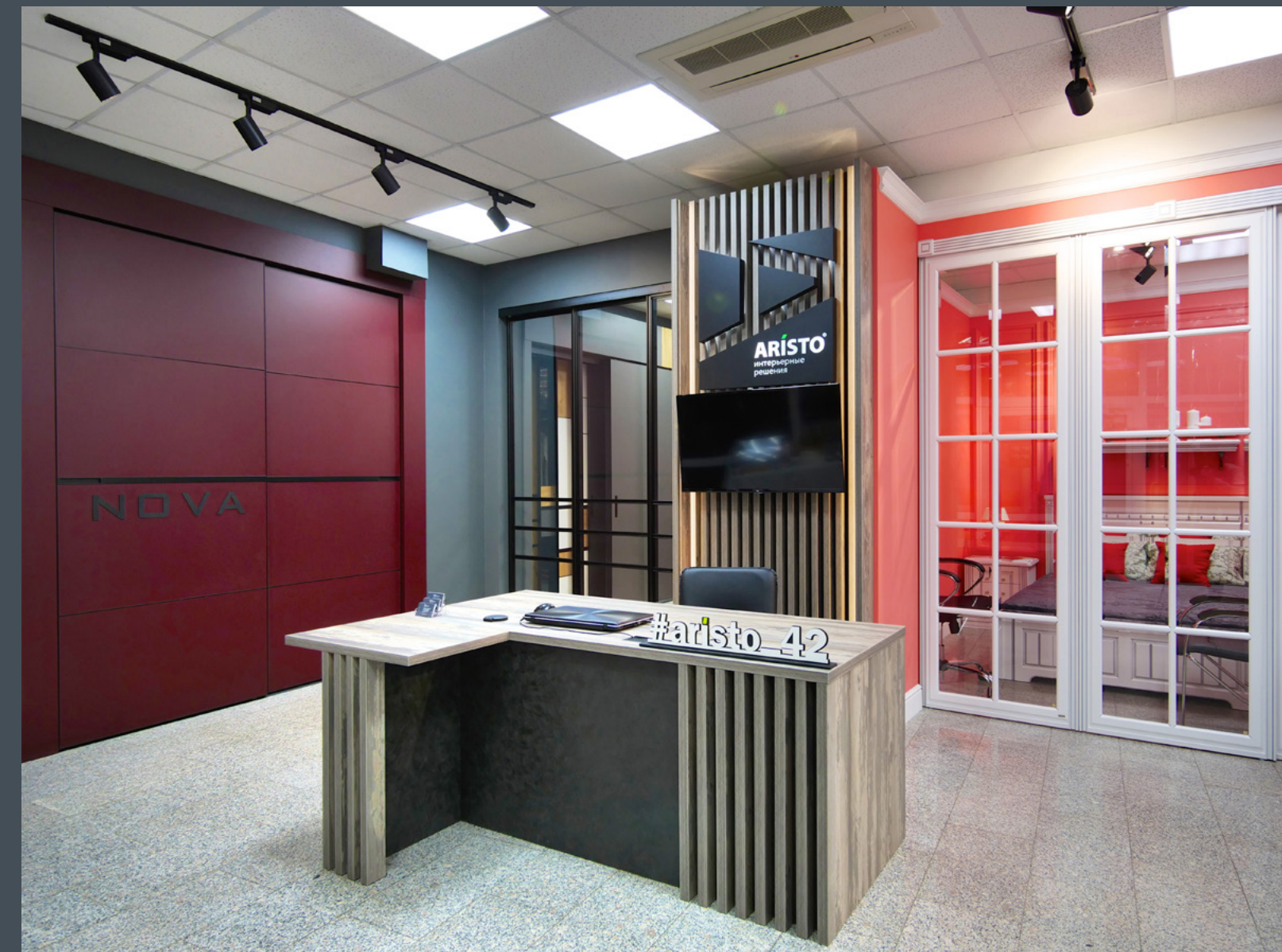
Салон Интерьерные решения ARISTO, г. Кемерово