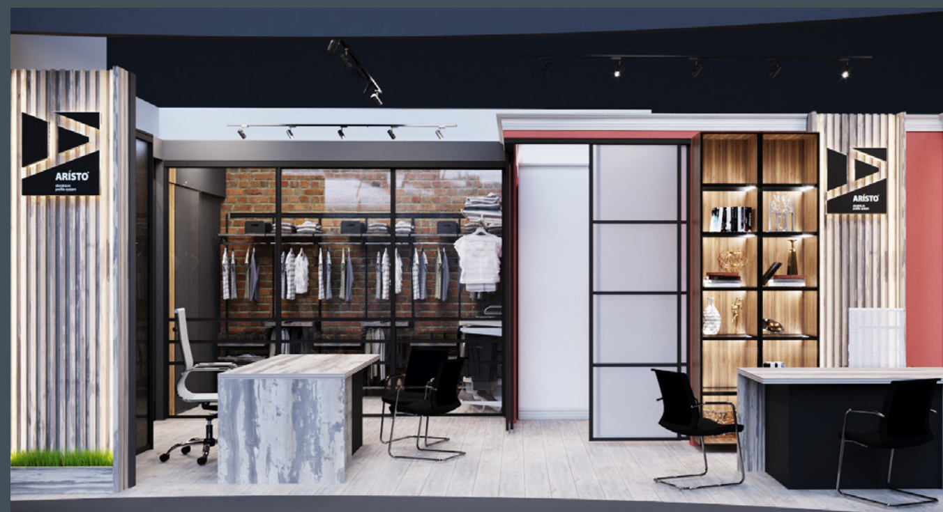
Салон Интерьерные решения ARISTO, г. Краснодар

На сегодняшний день, конъюнктура мебельного рынка весьма непростая. Для успешного бизнеса требуются новые нестандартные и свежие решения. Именно это и предлагает франшиза ARISTO.