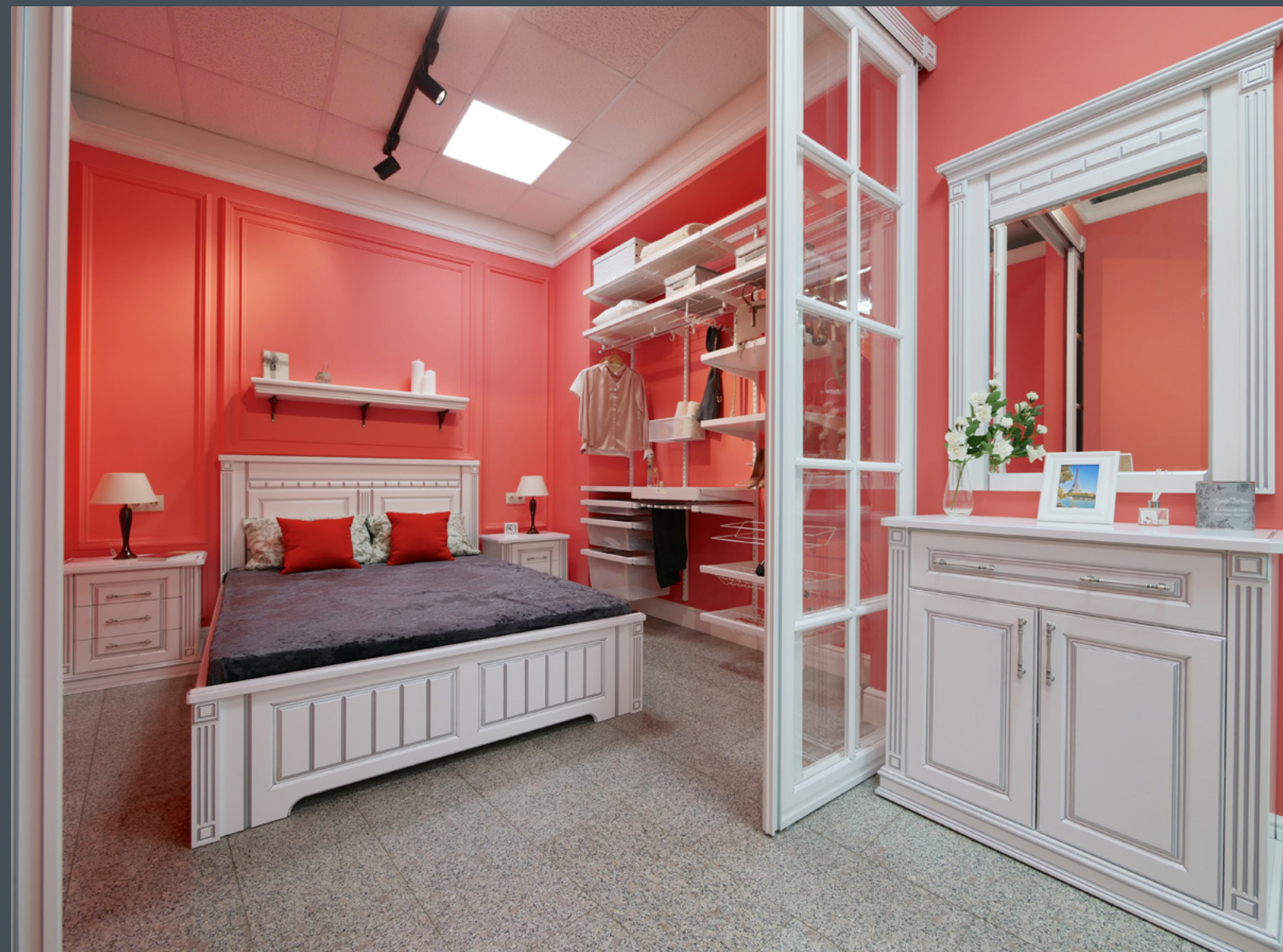
Салон Интерьерные решения ARISTO, г. Кемерово