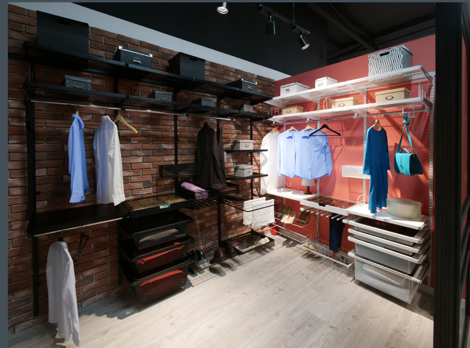
Салон Интерьерные решения ARISTO, г. Краснодар