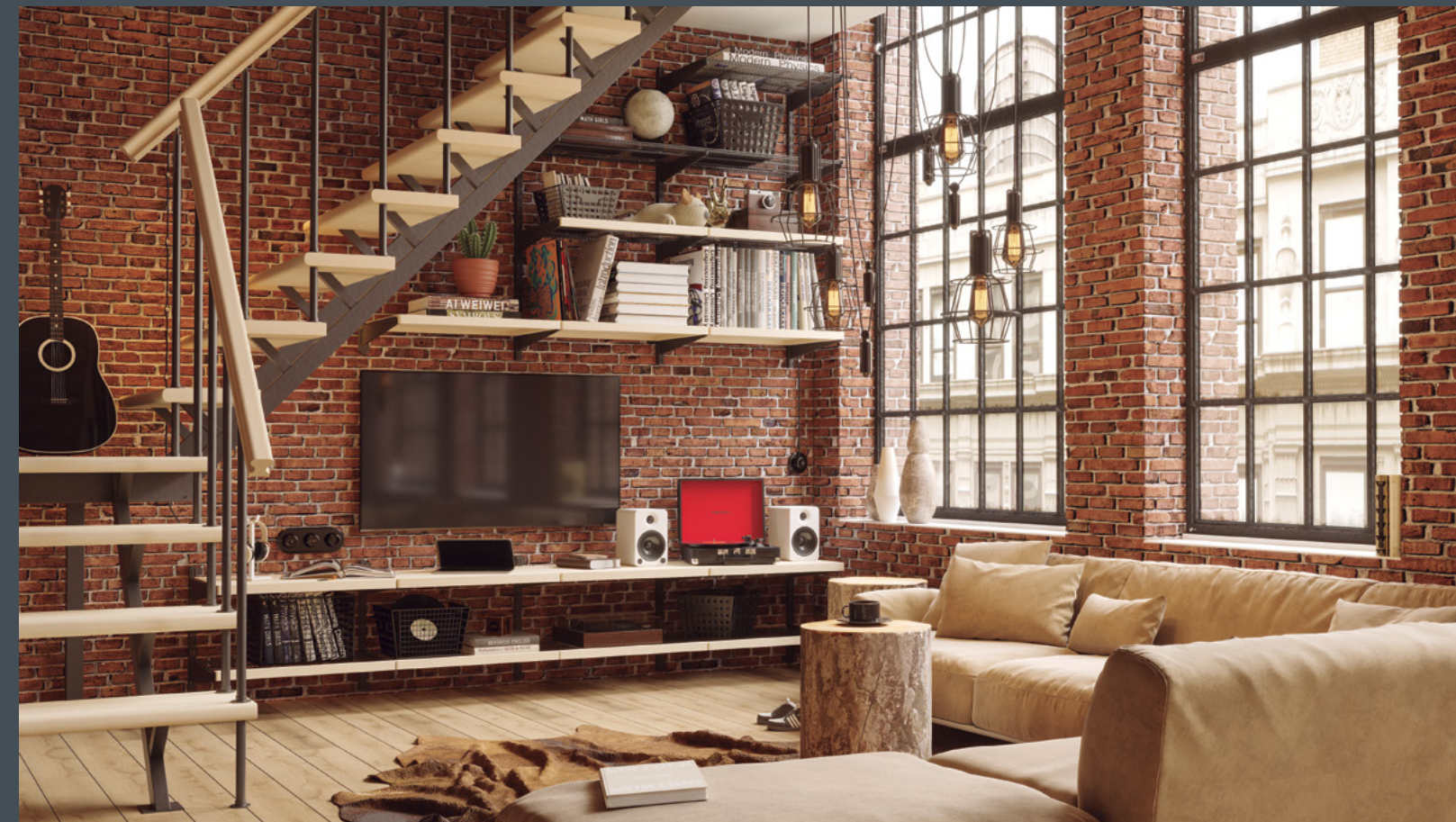
Реализация жилого пространства на основе продукции ARISTO