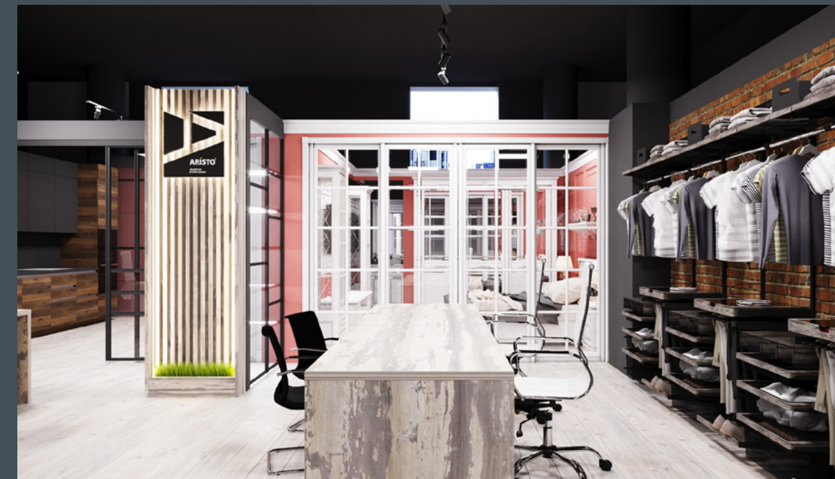
Салон Интерьерные решения ARISTO, г. Екатеринбург

Размещение Размещение на федеральном сайте ARISTO