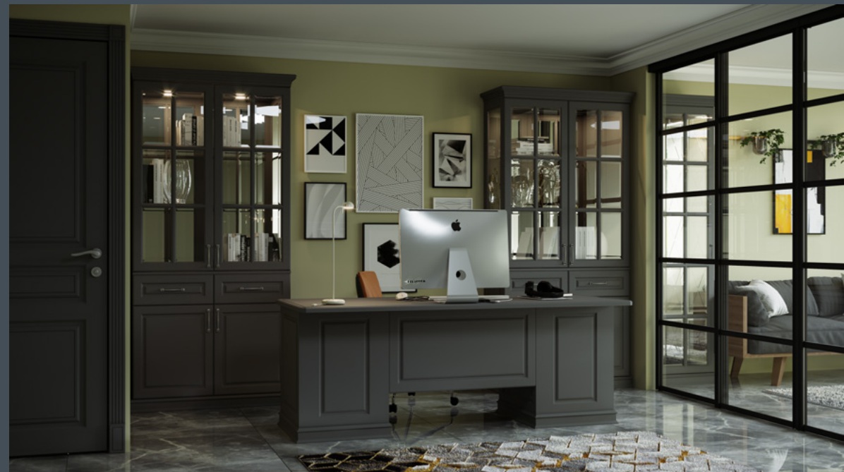
Реализация жилого пространства на основе продукции ARISTO